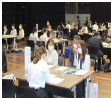
就職フェアでの面談の様子

県内の福祉関係施設・事業所に就職を希望される一般の方を始め指定保育士養成施設の学生さん等、たくさんの方にご来場いただきました。 来年はぜひ、ご参加ください。