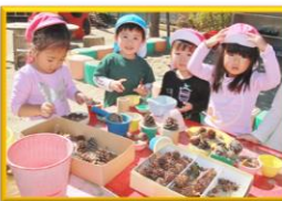
みんなで揃ったお芋を 囲炉裏で焼き芋