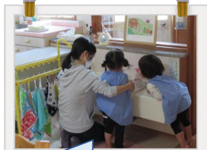
やさしく見守っていて素敵ですね♡

私は保育所等での勤務経験がなく、仕事内容に関してぼんやりしたイメージしかもっていなかったため、実技講習をお願いしました。今回、2歳児クラスを担当させていただき、子どもたちから、ぴっかぴかの笑顔とたくさんの元気をもらいました。また園では、こんな風になりたいなと思える先生方にも出会うことができました。正直なところ、自己紹介で「実習生です。」というには、かなりの勇気のいる年齢だったのですが、思い切って挑戦してみてよかったです。この実習に関わってくくださった全ての方に深く感謝申し上げます。