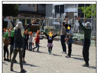
活発な子どもたち♡ 元気をもらえます！