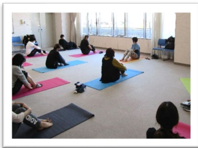
足指のストレッチ