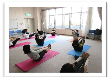
タオルを使ったストレッチ