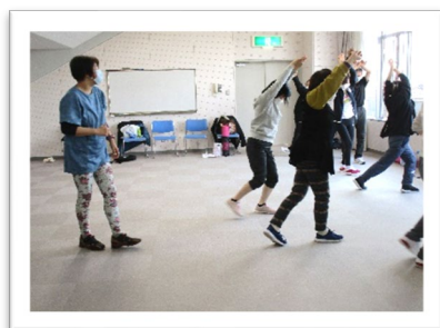
テューク式ウォーキング